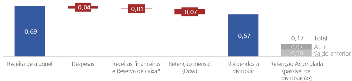
Gráfico de composição dos dividendos anunciados [em R$ por cota]: